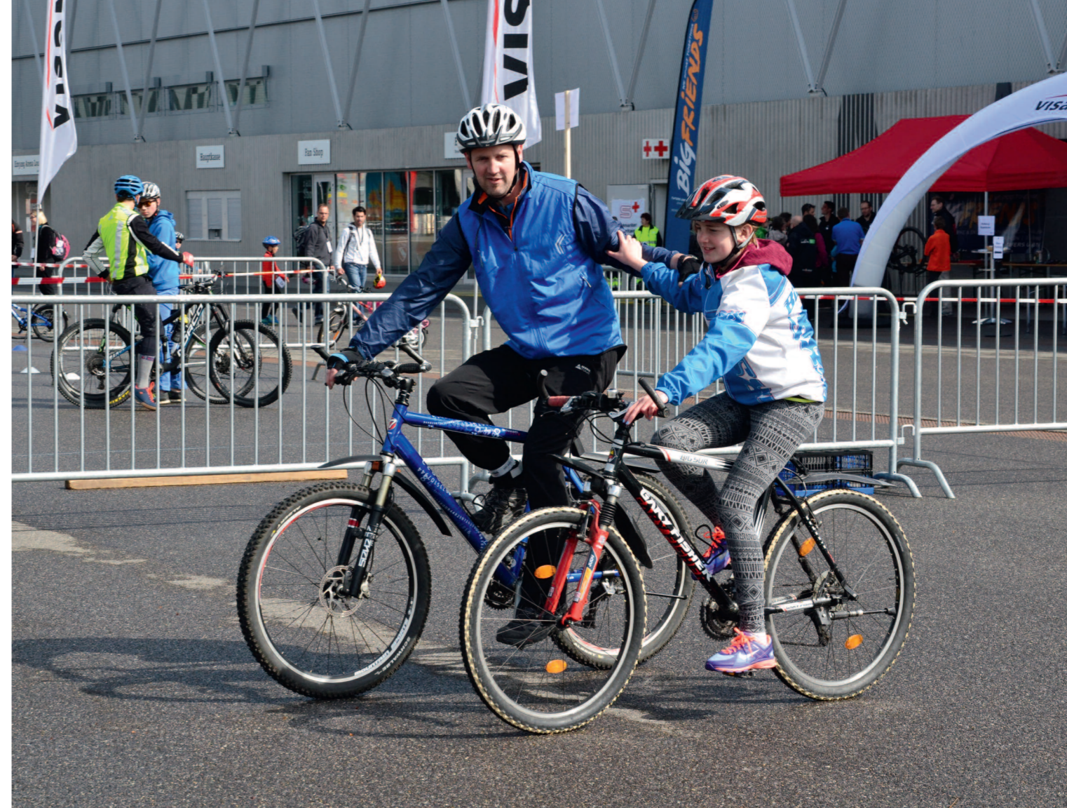
De meilleures compétences pour toute la famille.